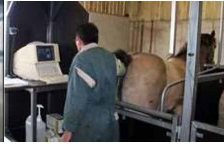
Echographie d'une jument

Un peu plus loin, pour défendre le fait de lutter contre la zoophilie, elle cite même une étude scientifique qui démontre statistiquement que la zoophilie provoquerait un cancer du pénis. La lutte contre la zoophilie deviendrait alors une nécessité pour garder la santé des zoophiles. De la même façon, la pratique de la fellation chez les êtres humains favorise le cancer de la gorge 27 , et jamais personne n'a cherché à interdire les relations sexuelles entre êtres humains.