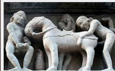
Homme ayant des rapports sexuels avec une jument pendant qu'un autre se masturbe ; sculpture à l'extérieur du temple hindou de Lakshmana à Khajurâho.

Nous mettons donc en garde le législateur sur le contenu de l'article 11 de cette Proposition de Loi, en ce que les effets de bords pourront être d'une puissance telle qu'ils rendront impossible bon nombre d'activités initialement non ciblées.