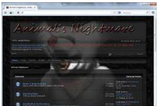
Le site zoosadique Animal Nightmare était disponible librement sur le dark web.

Pourquoi Animal Cross ne dénonce pas ces sites ? Pourquoi dénoncer des vidéos de femmes ayant des relations sexuelles avec des chiens ou des équidés, au lieu de dénoncer des vidéos où des chatons se font écraser par des êtres humains, où des chiennes se font attacher, violer, mutiler ?