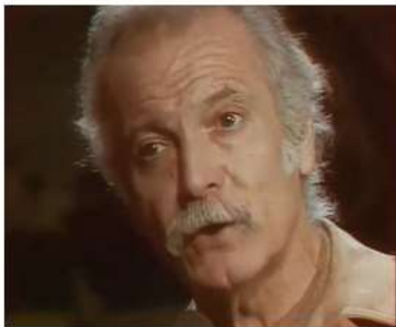
« Gare au gorille » de Brassens Une chanson zoophile

Il n'hésite pas non plus à appeler à la censure de la culture , en citant, par exemple, la très populaire chanson de G. Brassens « Le Gorille » dans son étude sur la zoophilie.