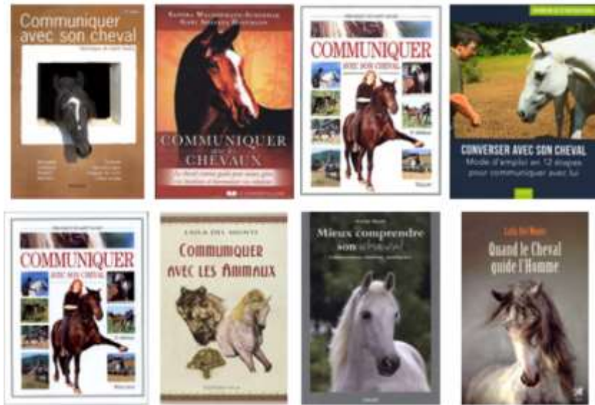
Exemple de livres sur la communication avec les chevaux

Concernant les chats et les chiens, il existe une infinité d'ouvrages sur le langage des animaux. 41