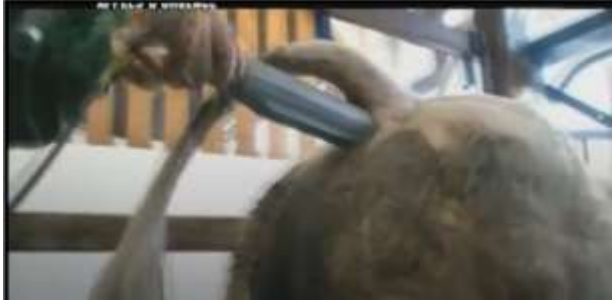
Electro-éjaculation d'un taureau