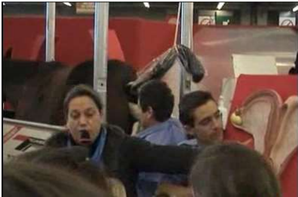
Stand des Haras Nationaux - Salon de l'Agriculture - Paris – 2006

Pour mémoire, une pratique d'insémination artificielle et d'échographie avait été réalisée lors du salon de l'agriculture de 2006 à Paris, devant des adultes et des enfants. 35